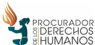
Procuraduría de los Derechos Humanos de Guatemala